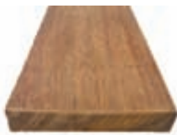
Lames 4 faces lisses 20 x 140 x 1800 mm et +