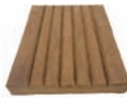
Lames 1 face rainurée 6V 20 x 140 x 1800 mm et +